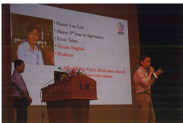
今回から新しく対象となったシニアレベルチームの発表。すでに事業をはじめているチームがほとんどでした。

昨年度の第 5 回までは、現役の大学生のみを対象としていましたが、今回は選考対象に 2 つのレベルを設定し、それぞれから優勝と準優勝を選考しました。ひとつは、大学院もしくは大学卒業から 5 年以内の社会人を対象としたシニアレベルで、もうひとつは大学の学部生を対象としたジュニアレベルです。カンボジアの大学を卒業後、海外の大学院を出てカンボジアに戻った者もシニアレベルとして参加できます。